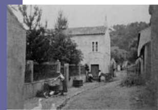
QUINTA DO PRADO - CASTELO DE VIDE - 1988/1989