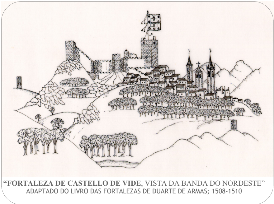
“FORTALEZA DE CASTELLO DE VIDE, VISTA DA BANDA DO NORDESTE” ADAPTADO DO LIVRO DAS FORTALEZAS DE DUARTE DE ARMAS; 1508-1510