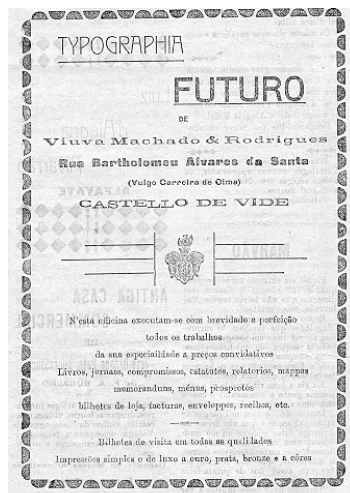
Anúncio da “Tipografia Futuro” que imprimiu o jornal Alto Alemtejo

A confissão que este popular filho de Castelo de Vide faz naquele documento deixa efectivamente transparecer as enormes dificuldades – tanto de ordem material como humana – que então se levantavam à edição de um jornal; mal grado o clima favorável despontado e dinamizado com a imprensa romântica ou de opinião, que se afirmara no país, sobretudo a partir da segunda metade de Oitocentos. Na maioria dos casos, só mesmo o estímulo suscitado pelas lutas políticas do século XIX tinham criado, acabando estas por terem sido o incremento para a afirmação da imprensa periódica, primeiro nos grandes centros e, posteriormente, noutras localidades onde o debate dos modelos políticos e institucionais foram mais acesos e