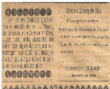
Anúncios insertos no Alto Alemtejo (n.º 1, p. 2 )

Zebro: n.º 14 «Leis ao Abandono. O sr. Visconde de Olivã, em Côrtes, profere um vehemente discurso sobre o Jogo e a Crise alemtejana»