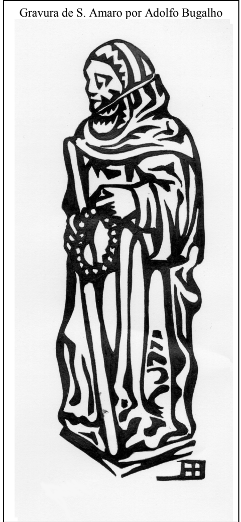
Gravura de S. Amaro por Adolfo Bugalho

Ainda segundo as fontes bibliográficas anteriormente citadas, outro episódio protagonizado entre Amaro e São Bento, sucedeu por altura do ano de 528 d.C., quando o Mestre entendeu abandonar o mosteiro em virtude do seu rigor e disciplina serem mal aceites por uns quantos discípulos. Relatam esses documentos que um dos principais contestatários, o Monge Florêncio, num estado profuso de alegria por observar a partida de São Bento, foi vítima de uma queda fatal.