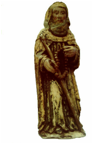
IMAGEM DE SANTO AMARO - SÉC. XV -

(PADROEIRO DO ANTIGO HOSPITAL DA SANTA CASA DA MISERICÓRDIA)