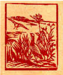
Paisagem com casal de perdizes