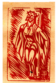
Cristo da coluna