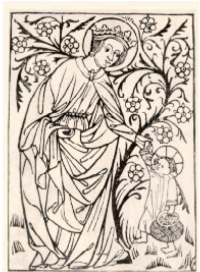
Santa Doroteia, 1420.

Graças ao facto de uma matriz permitir um vastíssimo número de estampas, com um dispêndio mínimo de esforço, tempo e dinheiro, as gravuras puderam ser vendidas por preços muito baixos, possibilitando assim, pela primeira vez na história, que as camadas sociais mais desfavorecidas tivessem acesso a imagens artísticas para uso próprio nos seus domicílios.