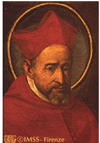
Roberto BELLARMINO (Montepulciano 1542 –Roma 1621)

Na certeza, porém, de que, o «Homem Barbudo» de Castelo de Vide detém um valor que superou todas as expectativas e, que, desde já, colocou o nome da nossa Notável Vila na investigação da cerâmica alemã do Renascimento.