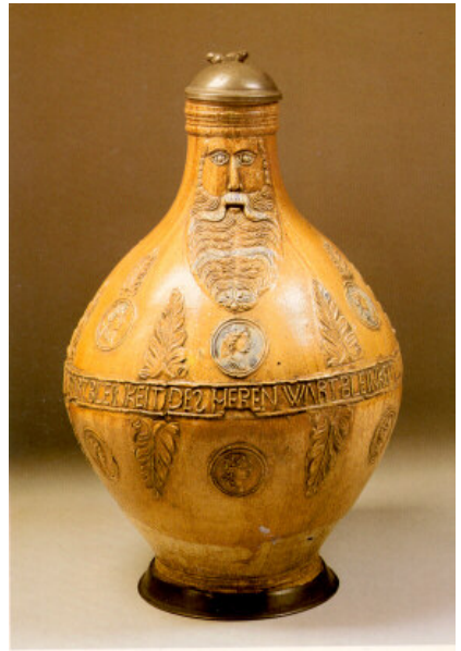
BELLARMINO: jarro «Homem Barbudo», em grés, produzido em Frechen, nas mesmas olarias em que foi produzido o jarro encontrado na Rua da Judiaria, em Castelo de Vide. Museum für Angewandte Kunst Köln (Colónia) - Alemanha

A Peça do Mês integra-se na cerâmica influenciada por esta corrente cultural vulgarmente designada por cerâmica do Renascimento , cuja origem também se verificou em Itália, no século XV, tendo-se prolongado pelo seguinte. Na centúria de quatrocentos, a faiança, à semelhança das artes nobres , vai aderindo à cultura humanista e, lentamente, as influências do gótico vão sendo lentamente substituídas pelas representações humanas da «Nova Era». Para tal, foi determinante o contributo de Lucca Della Robbia que, com os seus trabalhos em terracota, consegue uma aproximação entre a arte da cerâmica e a escultura florentina. A partir desta fase, ao mesmo tempo que é produzida a louça de uso doméstico (esta sobretudo funcional e prática, portanto, bastante simples e desprovida de ornamentações), passam também a aparecer recipientes cerâmicos com uma função ornamental. Para tal, os produtores de faianças inspiram-se frequentemente nos pintores para conceberem formas e decorações completamente novas.