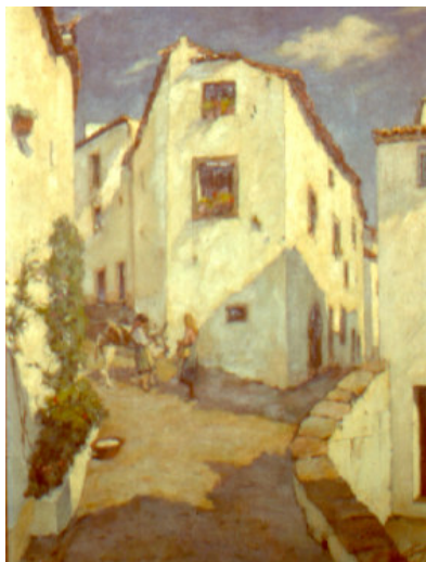
Casa 1 da Judiaria; alçado lateral sul. Pintura de Albertino Guimarães, óleo; 1955 (col. part. Joaquim Canário)

Não se pretende efectuar aqui a divulgação dos resultados da escavação, porém, para que o leitor fique com uma imagem dos materiais que acompanhavam os fragmentos desta nossa notável faiança, que ora figura como Peça do Mês , o mesmo é dizer doutros vestígios materiais que fizeram parte do quotidiano dalgumas gerações que habitaram