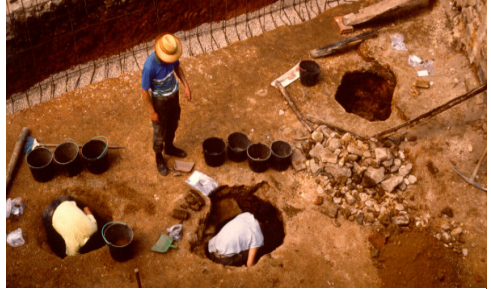
Casa 1 da Rua da Judiaria; Castelo de Vide. Fase da escavação dos silos 2, 3 e 4 (da direita para a esquerda).

Quanto à descrição individualizada do silo 2, este apresentou uma configuração piriforme, com profundidade de 2.26m e os diâmetros máxima de 0.82m na base, 1.60m no bojo e 0.60m na base plana. O espólio foi integralmente inventariado e tratado pela Secção de Arqueologia estando o cerâmico completamente catalogado. Encontra-se