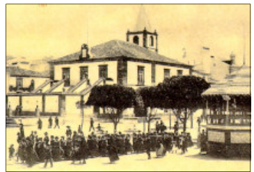
Imagens de três edifícios onde se sediou a Câmara Municipal: