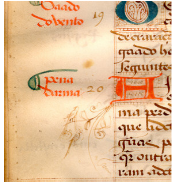
Pormenor da decoração. Duas aves empoleiradas em ramos que nascem numa letra capítular.

As letras capitulares inserem-se num rectângulo, ocupando duas unidades de regramento e são decoradas com motivos fitomórficos, filigranados e geométricos, numa sequência alternada de cor azul com vermelha. Em duas letras capitulares, nos versos dos fólhos V e VI, desenvolvem-se, no sentido das margens, ornatos vegetalistas mais elaborados, neste último com a representação de duas aves aparentemente exóticas.