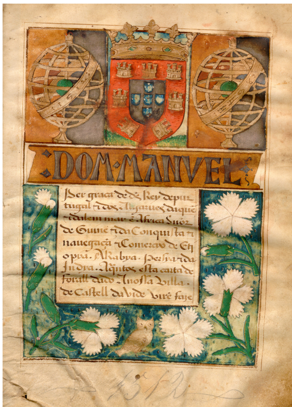
Incipit (Fl. 1)