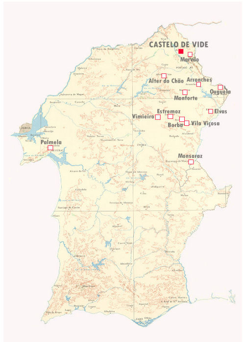
Povoações de Entre-Tejo-e-Odiana que tiveram os seus forais reformados a 1 de Junho de 1512.