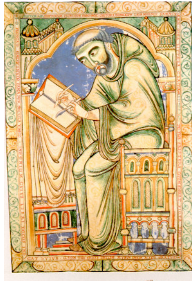
Iluminação do séc. XII (Livro de Salmos de Utreque) com auto-retrato do copista a empunhar o estilete e um fragmento de cana; instrumento que posteriormente foi substituído pela pena de ave (geralmente pato) que permitia maior facilidade na escrita.

Mas a evolução e as alterações da vida social nas populações, bem como o frequente desrespeito e constante abuso dos outorgantes